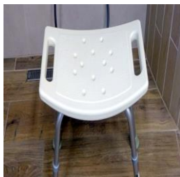
sedačka do sprchy bez opěrátka / s opěrátkem