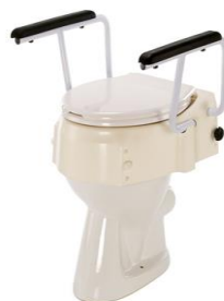
nástavec na WC s madly