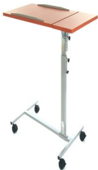
stolek k lůžku