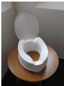
nástavec na WC