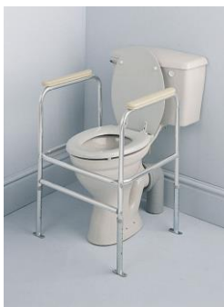
madla k WC