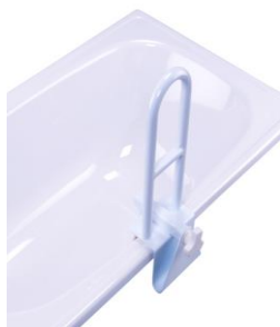
nasazovací madlo na vanu