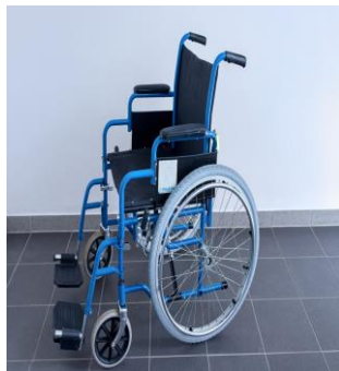
invalidní vozík mechanický