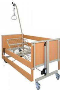
elektrická polohovací postel