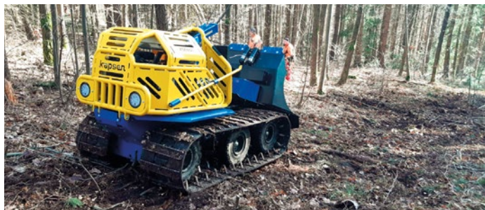
Nový pomocník při práci se dřevem.

POMOCNÍK Člověk a tažný kůň – od nepaměti patřili k práci v lese. Kůň pomáhal člověku s vytažením těžkých klád z nepřístupného terénu. I dnes jsou koně pro práci v lese využíváni, ve velké míře je ale nahradily stroje. V těch nejhůře přístupných lesích, nebo tam, kde je potřeba používat co nejšetrnější technologie, se používá železný kůň – malý pásový stroj na dálkové ovládání, díky kterému je práce mnohem bezpečnější. V případě dodržení bezpečnostních pravidel nehrozí těžké úrazy zapříčiněné sesmeknutím klády na kluzkém nebo