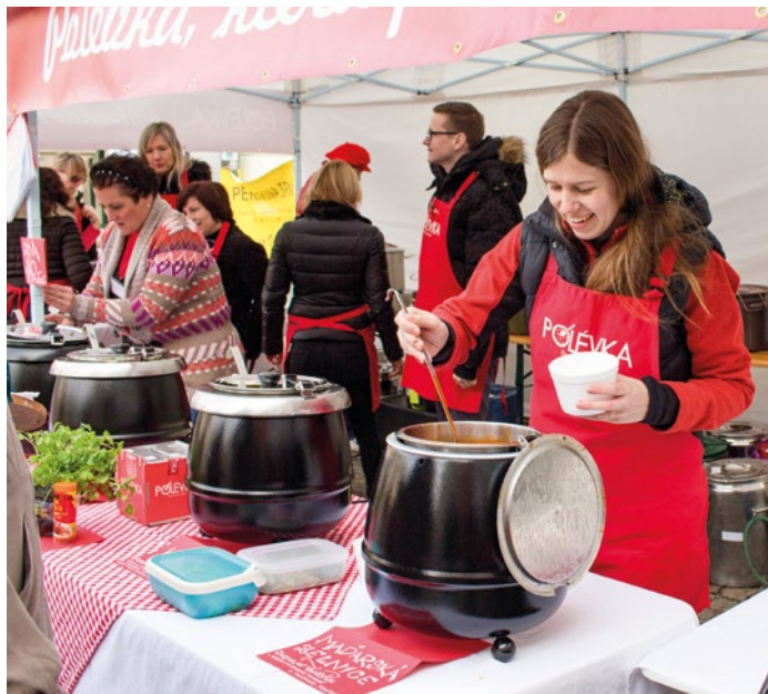
Přijďte na dobrou polévku a pomůžete dobré věci.

Organizátoři se letos rozhodli přizpůsobit aktuální koronavirové situaci a k tradičnímu stánku na náměstí přidají i rozvoz polévek. „Objednávky probíhají do 4. března přes online aplikaci, kde polévku rovnou zaplatíte. V den akce vám pak polévku dovezeme v obědovém čase na vámi uvedenou adresu. S rozvozem nám budou pomáhat kluci