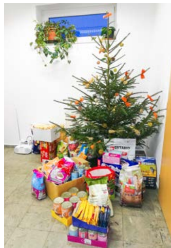
Zlomek nadílky pro útleková zvířata

Na oplátku tu pro všechny dvounožce bylo připraveno občerstvení, o které se postaral obchodní dům Kaufland, který Psí Vánoce každoročně podporuje. K podpoře útulku se letos připojila také Super zoo, která na svých prodejnách v Českých Budějovicích uspořádala sbírku, aby pak mohla krumlovské svě-