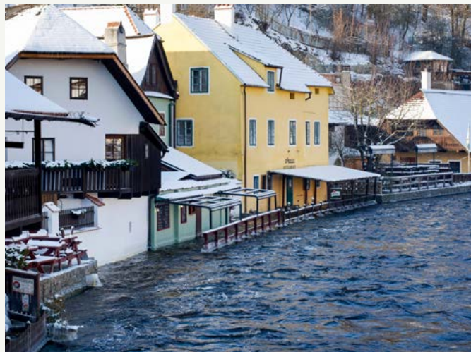
Škody budou majitelé počítat, až voda opadne.

Závěrem chci poděkovat všem členům bezpečnostních složek, kteří pomáhali povodeň zvládnout a všem lidem, kteří nabízelí a poskytli svou pomoc. Držme si pěsti, věřím, že už je to za námi a že brzy budeme chodit náplavkou kolem klidné Vltavy.