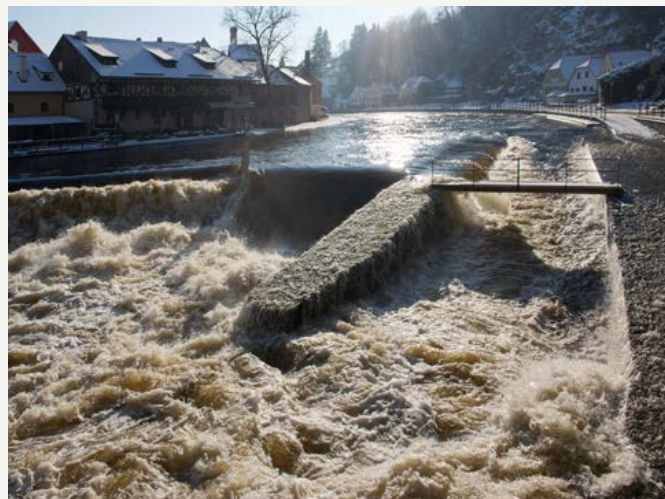
Termín náročné opravy jezu byl Povodím Vltavy dlouho zvažován a zohledňován. Bohužel, příroda nebere na takovéto plány ohled a může zaslat povodeň nebo oblevu kdykoli.