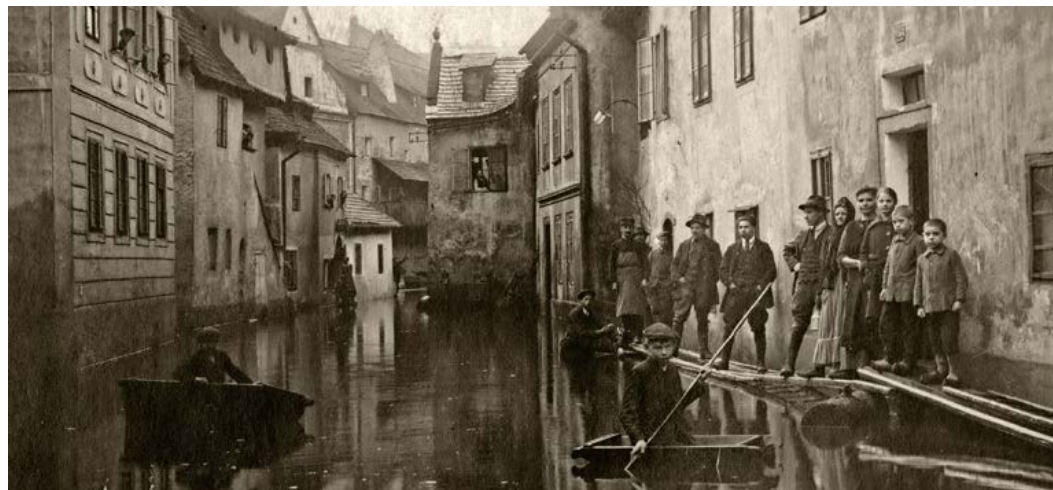
Povodně v roce 1920 zaplavily i ulici Parkán (Parkgraben).

V dnešní době se tento extrém vyskytuje naštěstí jen v omezené míře, bohužel povodně se nám v zimě zcela nevyhýbají, jak jsme se přesvědčili tuto zimu. |