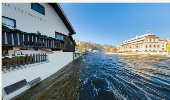
Povodni nejvíce zasažené domy v Rybářské ulici. V nejkritičtější okamžik dosáhla hladina Vltavy 226 centimetrů.

O Vánocích jsme tak během několika hodin měli Vltavu na 3. stupni povodňové aktivity, který se s občasným kolísáním udržel do první lednové dekády. Připomenu, že 3. SPA je kritickou hodnotou, kdy hrozí nebezpečí vzniku škod většího rozsahu v záplavovém území. Následně začala hladina postupně klesat