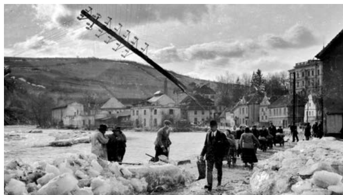
Ledové kry razící si cestu korytem Vltavy nadělaly cestou nemalé škody.