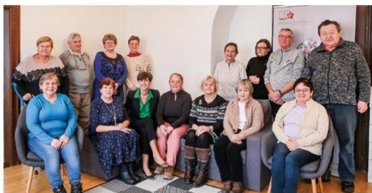
Vzdělávání bavi v každém věku.

Studenti Virtuální univerzity 3. věku v prosinci zakončili zimní semestr poslední lekcí tématu „Etika jako východisko z krize společnosti“ a „Dějiny oděvní kultury“. V tomto předvánočním čase bylo zvlášť obohacující zamýšlení nad smyslem života, morálkou, ctnostmi a výchovou dětí k etice. Tématem studia letního semestru 2023 budou „Evropské