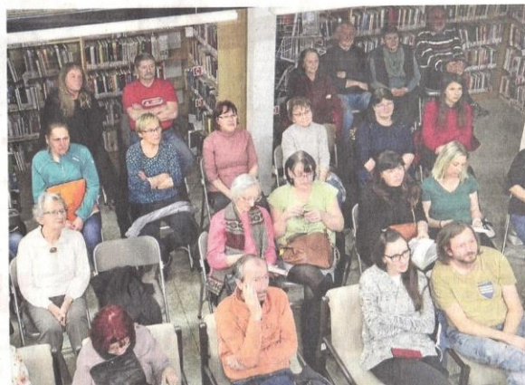
VÝSTAVY , besedy, přednášky, autorská čtení, koncerty, jazykové kurzy. To jsou jen některé akce, které pořádá Městská knihovna v Českém Krumlově.

také na natáčení videí pro čtenáře. Máme například cyklus Čtenářské jednohubky pro dětské čtenáře, pořizujeme záznamy z významnějších kulturních akcí. Videí jsme loni vyrobili asi sedmáct.