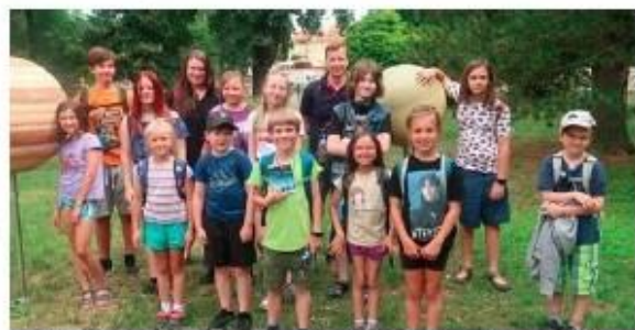
Děti si každoročně užívají prázdninové aktivity v knihovně.

Během týdne děti za každý splněný úkol sbíraly razítka do svého průkazu kosmonauta, aby si vysloužily povolení ke startu. Kosmonauti v rámci týdenního výcviku vyzkoušeli svou schopnost orientace v mapě, poslepu opravili životně důležitou součástku raketoplánu, při výstupu na rozhlednu Dobrá Voda