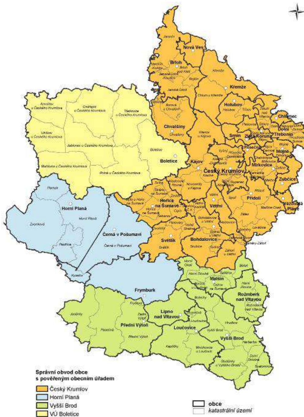
Obr. 1 Správní obvod Český Krumlov, Jihočeský kraj

Swou rozlohou 113 008 km 2 (k 31.12.2013) je ORP Č. Krumlov největším správním obvodem z obcí s rozšířenou působností v Jihočeském kraji.