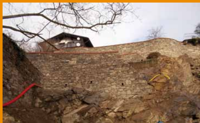
Dokončené části Jižních teras