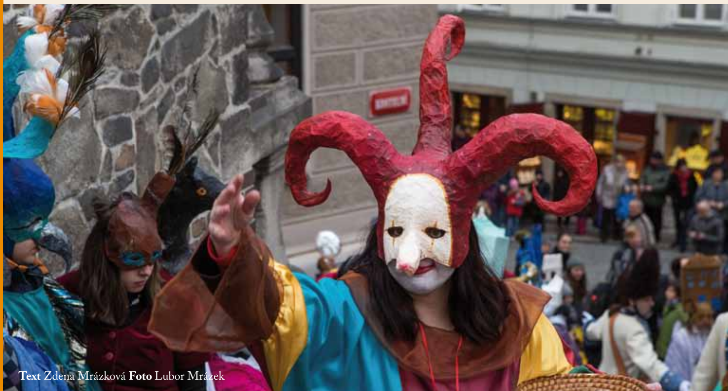
Text Zdena Mrázková

V sobotu 14. února 2015 bude v Krumlově mnohé k vidění, slyšení i k ochutnání. Svatý Valentýn se zde potká se začínajícím masopustem a jejich setkání bude jistě velmi bujaré. Oba svátky nabízejí tradiční pestrý program, který zase o trochu více prohřeje chlad únorových dní.