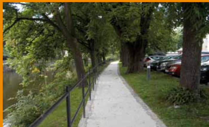
Stezka z městského parku směrem k Jižním terasám

Další informace je možné získat na Odboru investic Městského úřadu Český Krumlov nebo na www.ckrumlov.cz/projekty .