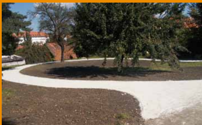
Stezka v Růžové zahradě

Dokončené části v rámci posílení atraktivit III. meandru