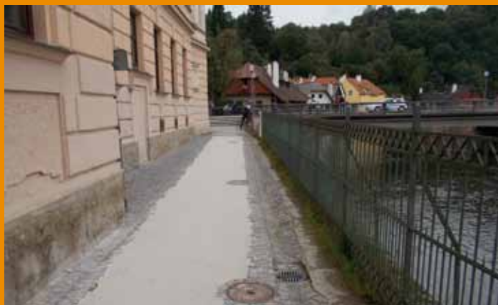
Stezka za ZŠ Linecká