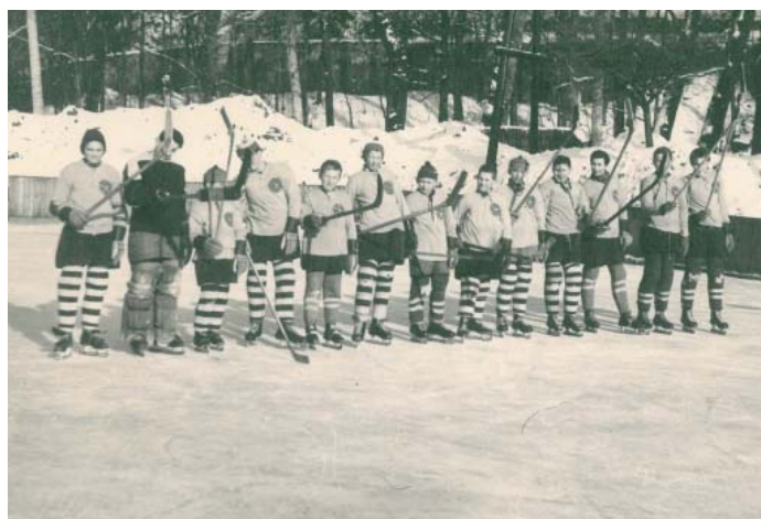
Jedno z prvních poválečných dorosteneckých družstev

Snaha o vybudování umělé ledové plochy v Českém Krumlově spadá do období kolem roku 1960. Tehdy se nabízel řešení spojit vybudování