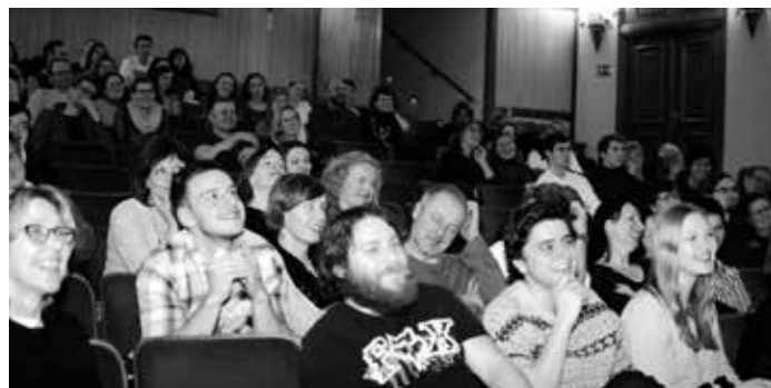
Festival Jeden svět každoročně láká diváky na zajímavé dokumenty.

FESTIVAL Život v informačním věku na člověka klade vysoké nároky – rozlišovat, co je pravda a co není, sdílet, komentovat, mít názor. Letošní 20. ročník Mezinárodního festivalu dokumentárních filmů o lidských právech Jeden svět , který se bude konat od 5. do 14. března v Praze a následně v 36 dalších městech po celé České republice, vybízí k aktualizaci systému . Nejen počítačové systémy totiž potřebují čas na to, aby zpracovaly všechny potřebné informace a mohly hladce fungovat. Zhlédnutí dokumentů a navazující debata divákům poskytuje prostor k něčemu, na co v každodenním životě plněm (dez)informací ze sociálních sítí někdy nemají čas: zpomalit, v klidu se zamyslet nad konkrétním tématem, nahlednout ho z různých úhlů a zasadit si jej do kontextu. V Českém Krumlově proběhne Jeden svět letos již po osmém. Školní projekce odstartují v pondělí 19. 3. a poběží na 4 promítacích místech až do pátku 23. 3. Jeden svět dětem nabízí sadu filmů pro žáky od 8 do 13 let. Krátké dokumenty s moderovanou debatou zprostředkují témata jako chudoba, vzdělávání, rodina, život s jinakostí a sociální vyloučení. Jeden svět pro studenty je určen žákům vyšších ročníků ZŠ a studentům SŠ. Filmy s cirká hodinovou stopáží nabízejí hlubší vhled do problematiky ekologie, života s postižením, válečných konfliktů, extremismu a svobody slova. Tyto speciální projekce v minulých letech navštívilo přes 1 000 žáků a studentů z regionu.