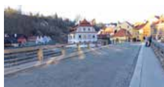
Na mostě bude zamezen vstup na chodníky.

Město má v současné době vyčleněné finance na projektovou dokumentaci