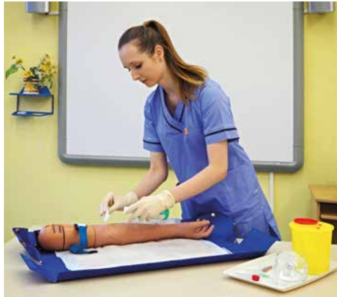
Studenti zdravotnických škol se nemusejí strachovat, že nenajdou zaměstnání.

Práce ve zdravotnictví je formou životní a pracovní jistoty. Životní úroveň