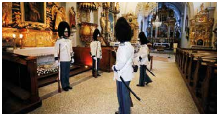
Granátníci obnovili velikonoční tradici stráže u Božího hrobu.

GARDA Formou pravidelných příspěvků a medailonů bude na těchto stránkách v následujících měsících Archiv Schwarzenberské granátnické gardy seznamovat občany města Český Krumlov s výsledky své výzkumné činnosti spolu s těmi nejzajímavějšími objevy souvisejícími s historií granátnické gardy a našeho města, jichž se v posledních dvou letech existence archivu podařilo studiem archiválií, artefaktů a vzpomínek pamětníků dosáhnout. Třebaže posláním gardového archivu je primárně prohlubovat vědecké poznání o minulosti granátnické gardy, má ve vztahu k tzv. Programu obnovy hradní stráže v Českém Krumlově rovněž za úkol zajišťovat podklady, na jejichž základě se uskutečňuje praktická realizace konkrétních kroků v rámci tohoto programu. Svým výzkumem tak archiv umožňuje, aby návrat granátníků zpět do života našeho města probíhal cit-