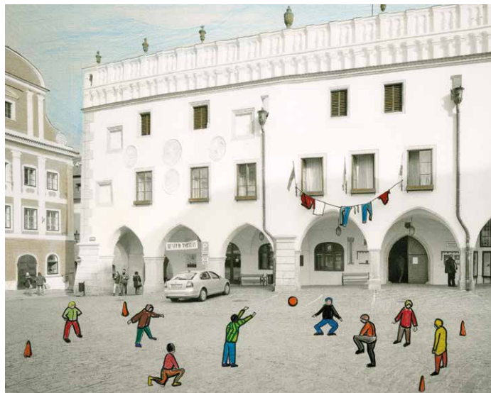
Kresba projektu UNES-CO

V Českém Krumlově vzniká jedinečný projekt UNES-CO umělkyně Kateřiny Šedé, která netradičním způsobem uchopila problematiku vylidňujících se center měst a jejich oddizování obyvatelům. Projekt bude reprezentovat Českou republiku na 16. mezinárodním bienále architektury v Benátkách.