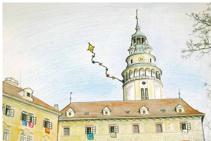
Kresba projektu UNES-CO

Více informací naleznete na webových stránkách www.unes-co.cz .