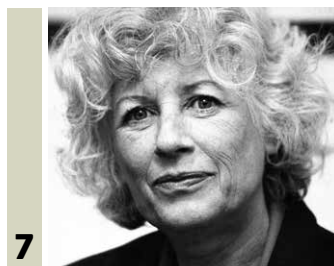
7 Strom Olgy Havlové