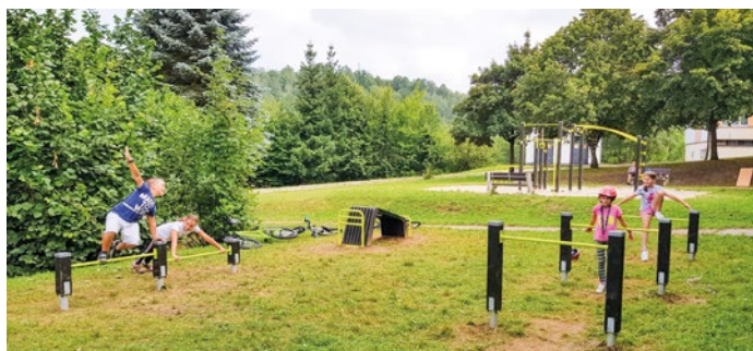
Na Plešivci přibýly tři nové fitness prvky.

Na sídlišti Plešivec přibýly tři nové fitness prvky, které slouží ke kruhovému tréninku, jenž je ve světě fitness již delší dobu trendovou aktivitou. Sportovcům je tu nově k dispozici nakloněná lavice pro cvičení zad a břicha, tři po sobě jdoucí překážky, které je možno aktivně přecházet, přeskačovat nebo podlézat, třetím prvkem jsou dvě tyče na svislých podpěrách v různých výškách pro cvičení kliků či přeskoků. „Nové prvky jsou umístěné vedle streetworkoutové věže, kterou si obyvatelé navrhli už v prvním ročníku participativního rozpočtu. Postupně tu vzniká fitness aréna, která v konečné podobě nabídne dvanáct prvků pro procvičení celého těla,“ uvádí Martin Tomka, ředitel společnosti PRO-SPORT ČK.