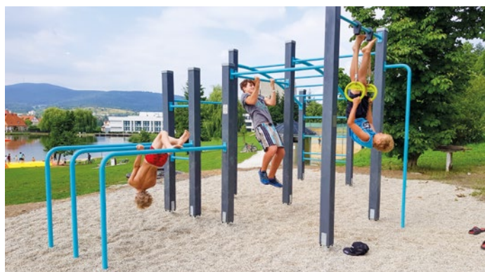
Workoutová sestava u Hornobránského rybníka.