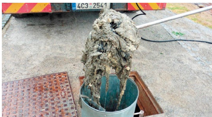
Odpad pocházející z kanalizační sítě, který obsahoval tuky, vlhčené ubrousky, biologický odpad, ale i drátěnku na nádobí, utěrku a ponožku.