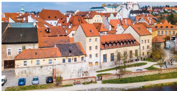
Prádelna opět ožívá.

Začneme v sobotu 14. září výstavou Rozhraní, která představí architektonické návrhy a modely pro Krumlov, jež připravili studenti Vysoké školy uměleckopřmyslové v Praze. Výstava bude otevřena vždy v sobotu a neděli od 14 do 19 hodin až do konce září. O prvním otevřeném víkendu (14.-15. září) se zároveň uskuteční dvě večerní akce Letňáku v Prádelně. V sobotu to bude divadelní představení s vlastním DJ