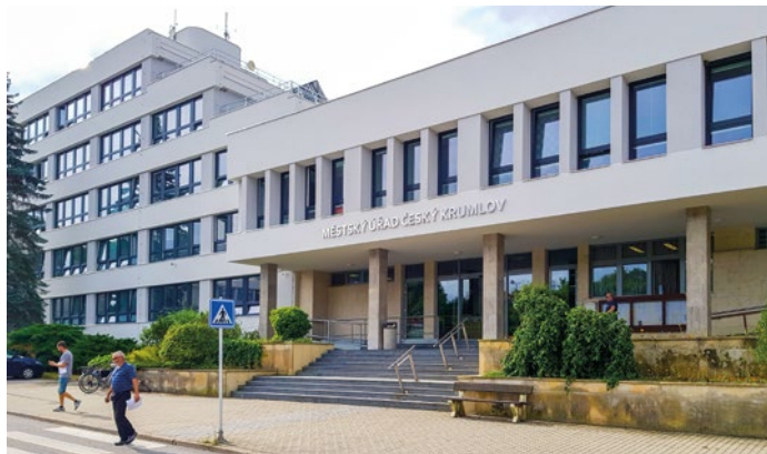
Zrekonstruovaná budova městského úřadu v Kaplické ulici.