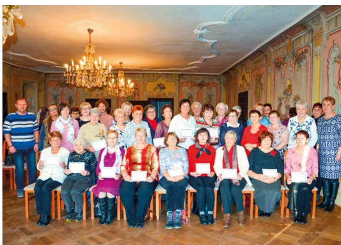
Absolventi Akademie 3. věku.