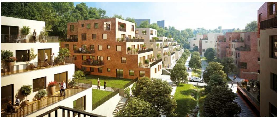
Vizualizace nové městské čtvrti.